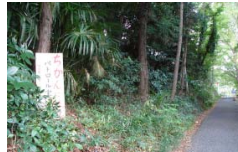
羽西3丁目の保存樹林地

竹が伸びすぎて、この道路とその下の道路が暗い。また、奥多摩街道に信号機の設置をお願いしたい。 市民の声