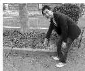
アンケートの声をもちに調査活動。「ここにも犬のフンが…」