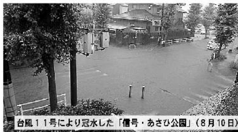
台風11号により冠水した「信号・あさひ公園」(8月10日)