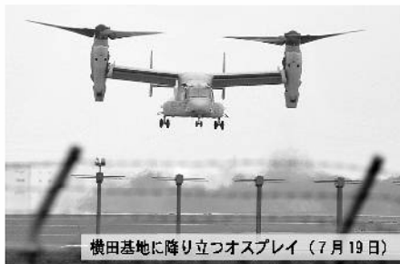
横田基地に降り立つオスプレイ (7月19日)