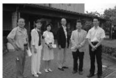
■新人議員で市内施設の視察