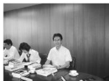
■市の部長を講師に3日間の勉強会

した戦争は正しかった。アジアを解放したんだ」と子どもにも教え込むものです。この教材が羽村の小中学校にもちまれないよう教育長に申し入れをおこないました。教育長は、調査することを約束しました。