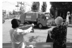
小金井市のごみ搬入に市民が抗議

西多摩衛生組合への小金井市ごみ持ち込み問題で、市民の疑問や不安にしっかり応えるべきです。