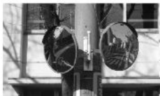
子どもが多く、設置が望まれていた三中前のカーブミラー