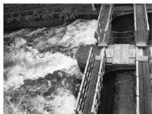
勢い良く水が流れる羽村の堰

◆一方、羽村市6月議会では、羽村の堰で小水力発電をおこなうことを提案しました。毎秒10トン以上の水が玉川上水に勢い良く注いでいます。ここで発電をおこなえば、一般家庭数百軒分の電気を生み出せる計算になります（水量は季節により変動します）。