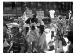
集会後、表参道をパレードする若者たち

◆市長は消極的な姿勢を示しましたが、原発ゼロを決断し、自然エネルギーの普及に本気になってとりくんでいく社会にむけて、羽村からも大いに声をあげていきたいと思えます。ぜひ皆さんのご意見も、お寄せ下さい。