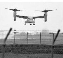
7/19 横田に降り立つオスプレイ

●世界中で重大な事故をくり返している「オスプレイ」が19日と21日、横田基地に飛来しました。●自治体や議会が「反対」の態度を示す中、聞く耳を持たずに「強行」する米軍の姿勢はひどいものです。●一緒に「飛来の日常化・配備をするな」の声を上げていきましょう。